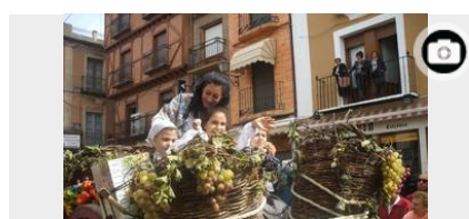
Desfile de carros de vendimia en Toro

Los comentarios están sujetos a moderación previa y deben cumplir las Normas de Participación